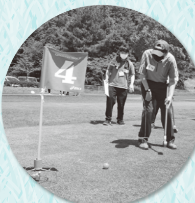
ホールポストをねらって