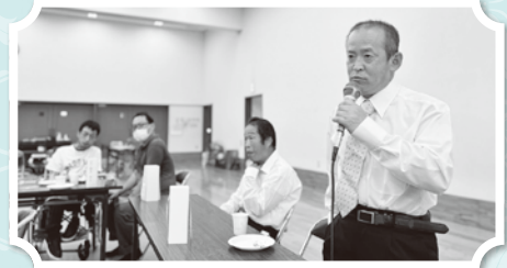
法人への要望を伝えました