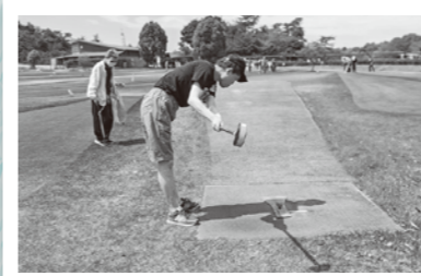
練習の成果を出すぞ

新型コロナウイルス感染症は第5類に移行しましたが、重症化リスクが高い人たちが集まる福祉施設においては、施設内で感染が広がらないような対策をおこなうよう国から求められています。これを踏まえ一れつ会では、引き続き三密回避やマスクの着用、手洗いやうがい、手指消毒や検温、換気の実施、事業所館内や公用車の消毒などの取り組みを続け、感染症予防をしながら活動や行事を行っております。