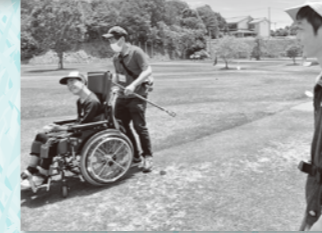
天気がよくてよかった