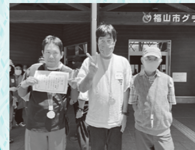
2位 表彰うれしかった！