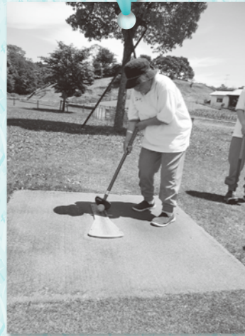
ボールをよく見てうつぞ