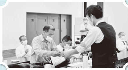
任命書を授与されました！