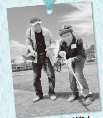
がんばれ！がんばれ！