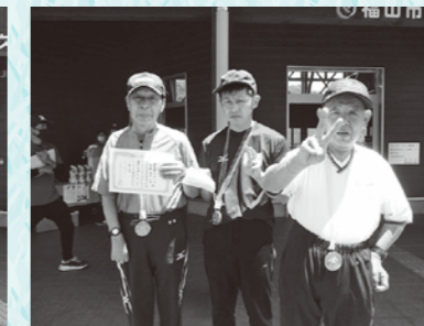
1位 記念になったね